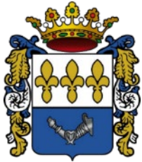
AYTO. DE VILLATOBAS