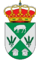
AYTO. DE CABAÑAS DE YEPES