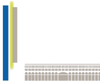
AYUNTAMIENTO DE NOBLEJAS

ORGANIZACIONES A LAS QUE ESTAMOS ASOCIADOS: