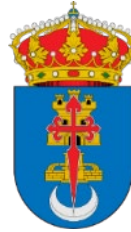
AYTO. DE DOSBARRIOS