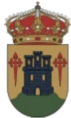
AYTO. DE VILLARRUBIA DE SANTIAGO